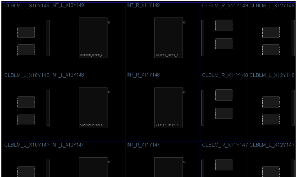
図 1: INT タイルの位置