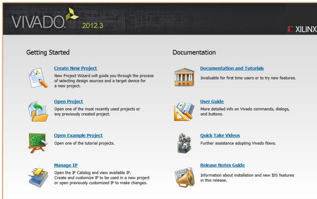
図 3-2 : Getting Started ページ